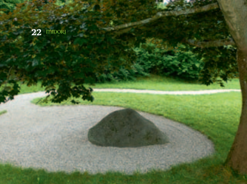
oben Schlichte Kieswege und -beete mit Findlingen fügen sich harmonisch ins Bild.