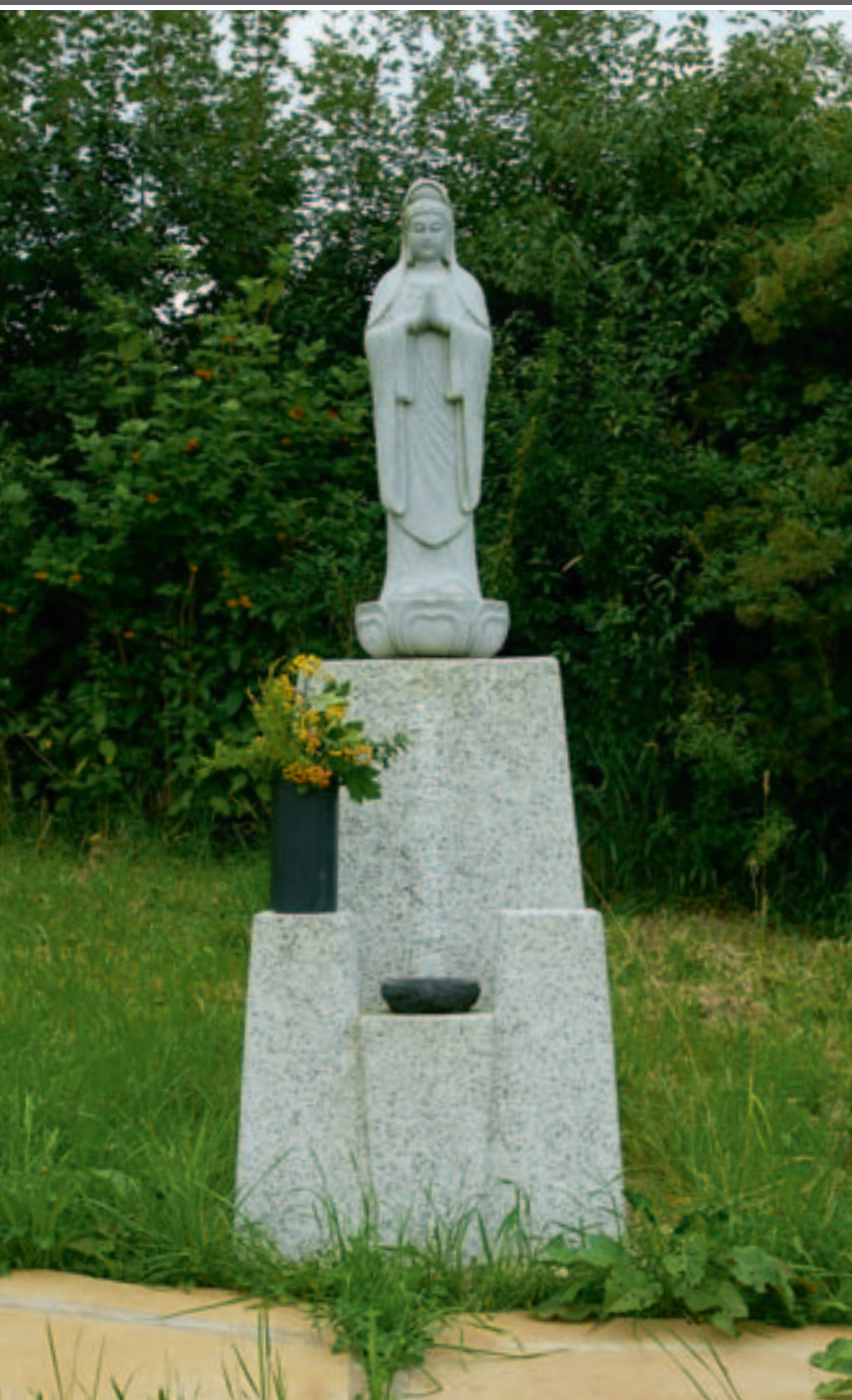
Unten Eine buddhistische Figur steht wie selbstverständlich in einer Streuobstwiese.

dichten, Architektur und Zen beschäftigen. Heute ist mir klar, dass diese Art der Ausbildung, in der v. a. Wert auf die eigene Erfahrung gelegt wird, ein sehr guter Weg ist, um ein Gefühl für Harmonie, Proportion und Schönheit zu entwickeln.«